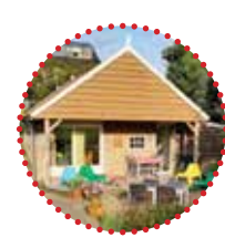
Bed & Breakfast Bonte Varlen